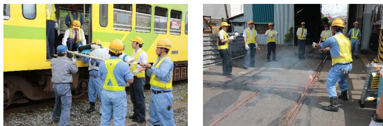
(参考・訓練の様子)