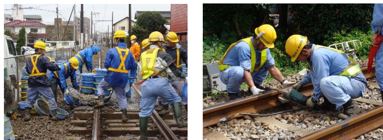
(参考・線路の点検の様子)

流馬（さくら）号の全般検査、なの花号の重要部検査、小金城趾駅の転てつ器凍結に備えて電気融雪器の設置、小金城趾駅一鱒ヶ崎駅間700mの線路扛上工事、西平井変電所の制御盤の更新、インフラ長寿命化における大谷口橋梁修繕工事、第21号及び第25号踏切道舗装板修繕工事、流山駅構内2番線枕木交換18丁及び軌間整正工事、4k364～389m間饋電線ケーブル化変更工事、輪重測定装置の校正修繕工事、リフティングジャッキリレー更新工事を実施いたしました。