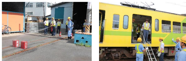
(参考・訓練の様子)