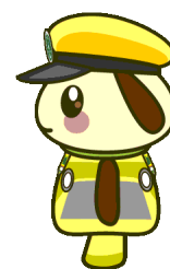
流鉄キャラ りゅうのしん

〒270-0164 千葉県流山市流山一丁目264番地 流鉄株式会社 総務部 TEL 04-7158-0117 (土日祝日を除く9時～17時)