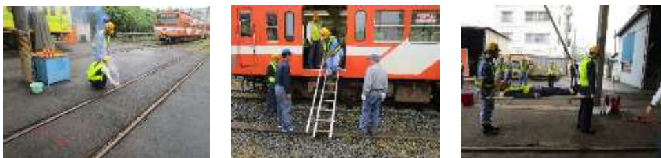
(参考・訓練の様子)