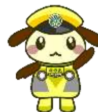
流鉄キャラ りゅうのしん

〒270-0164 千葉県流山市流山一丁目264番地 流鉄株式会社 総務部 TEL 04-7158-0117 (土日祝日を除く9時～17時)