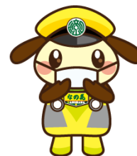
流鉄キャラ りゅうのしん

〒270-0164 千葉県流山市流山一丁目264番地 流鉄株式会社 総務部 TEL 04-7158-0117 (土日祝日を除く9時～17時)