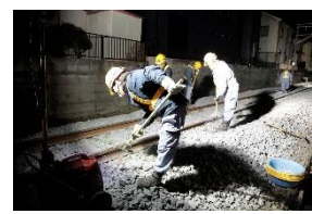
（参考・保守作業の様子）

なお、第21号踏切道安全装置更新工事及び鱒ヶ崎駅・平和台駅間の道床修繕及び排水設備工事につきましては流山市・千葉県・国から補助金によるご協力をいただきました