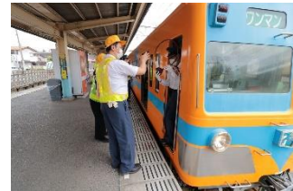
（参考・訓練の様子）