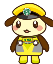
流鉄キャラ りゅうのしん

〒270-0164 千葉県流山市流山一丁目264番地 流鉄株式会社 総務部 TEL 04-7158-0117 (土日祝日を除く9時～17時)